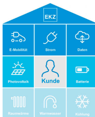
Integrierte Gebäudelösungen der EKZ.