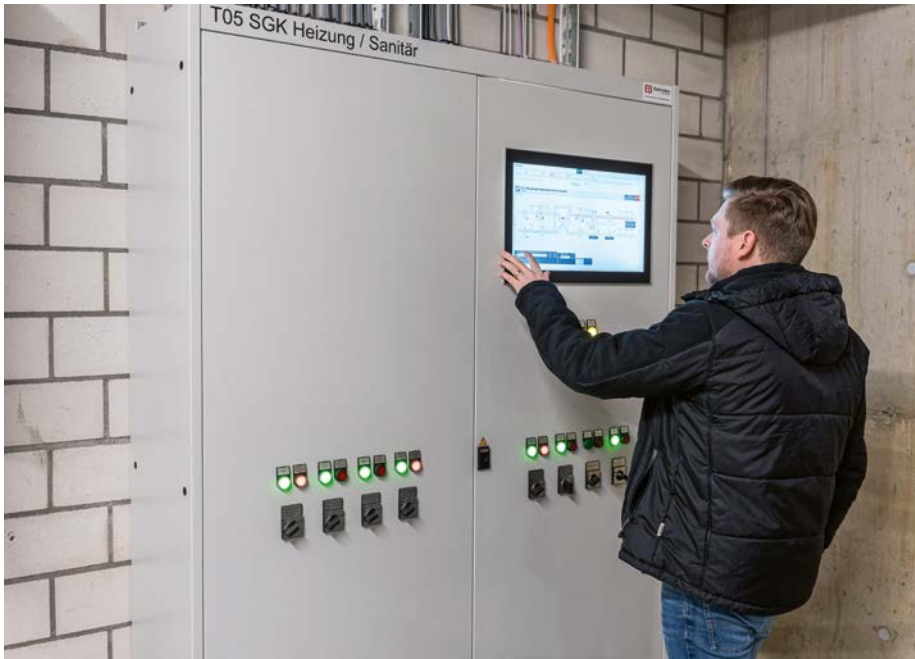
Plausibilisierung von Daten im Gebäudeleitsystem.

Fühlern aufgenommen und von Aktoren in Schaltsignale umgewandelt werden, um sie für die oberen Ebenen bereitzustellen. Die sich in der Mitte befindende Automations-ebene übernimmt die Überwachung, Steuerung und Regelung der technischen Anlagen. Zuoberst, auf der Managementebene, erfolgt die erweiterte Bedienung über das ganze Gebäude, indem Prozesse beobachtet und bei Störungen Alarme ausgelöst werden.